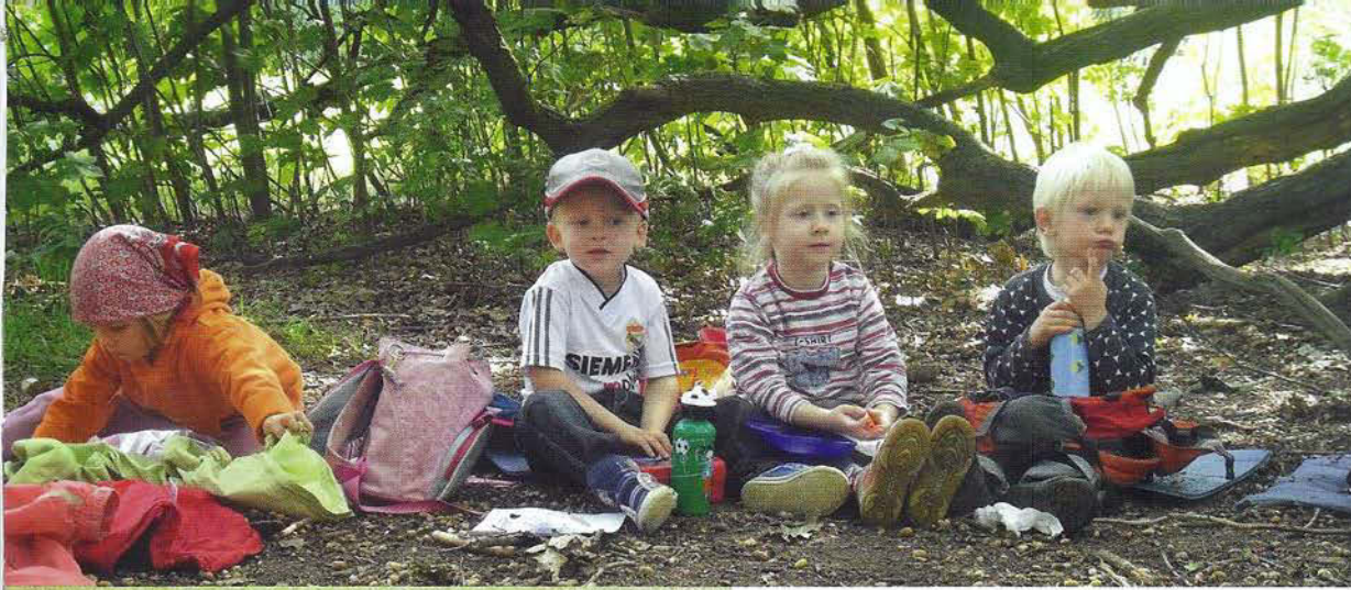
Waldwichtel-Kinder beim gemütlichen Sommerfrühstück.