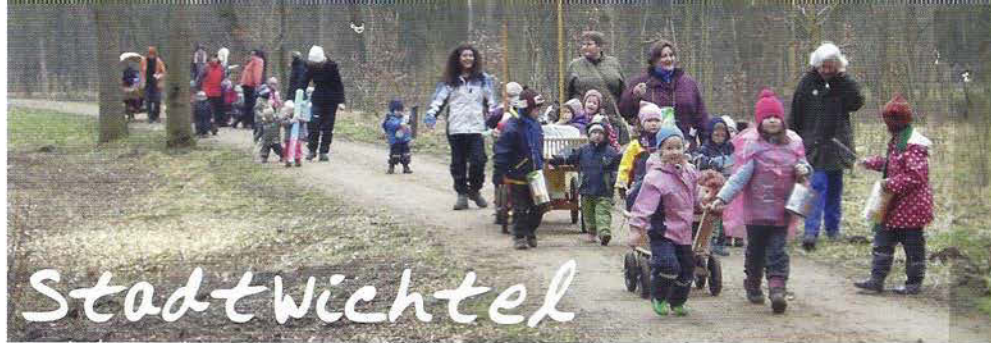
Jährliches Winteraustreiben im Bremer Stadtwald.

(...) Mit der Übernahme der Aufgabe ... leisten sie einen bedeutsamen Beitrag zur Qualitätssicherung anderer Kindertageseinrichtungen.“ In der Praxis bedeutet dies, dass pädagogische Fachkräfte aus anderen Bremer Kindertageseinrichtungen sowie Schüler, Studenten und Praktikanten die Möglichkeit haben, die pädagogische Arbeit der Kindertagesstätte kennenzulernen und sich umfassend zu informieren. Da StadtWichtel e.V. ein Elternverein ist, wird das ehrenamt-