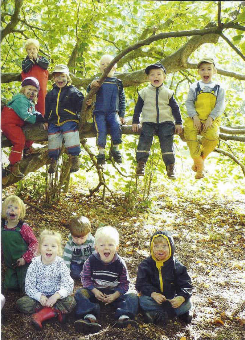
Die Waldwichtelkinder in ihrem "grünen Gruppenraum", dem Bürgerpark.