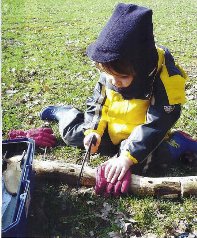
Sägen: Eine von vielen Beschäftigungen im Wald.